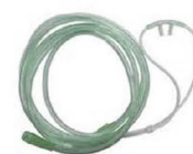
Lunettes à oxygène