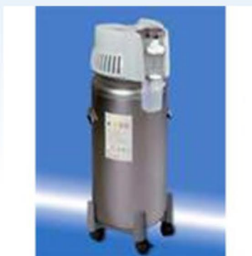
Cuve d'oxygène liquide

Oxygène maintenu sous forme liquide à une température de -183\text{ °C} dans un réservoir « thermos » de 30 ou 45 litres.