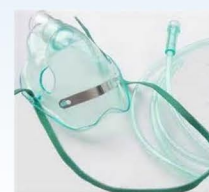
Masque à oxygène Débit supérieur à 5 l / min