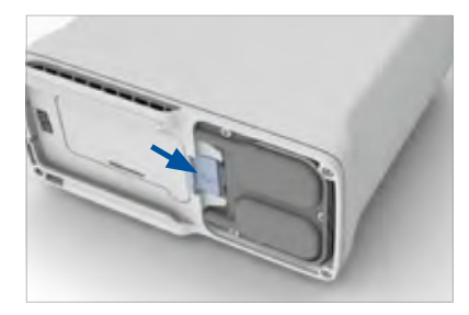
Ouvert et déverrouillé

6. Maintenez le bouton en position ouverte et sortez les colonnes du dispositif en tirant sur la poignée correspondante.