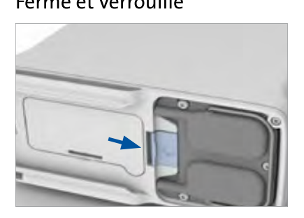
Fermé et verrouillé